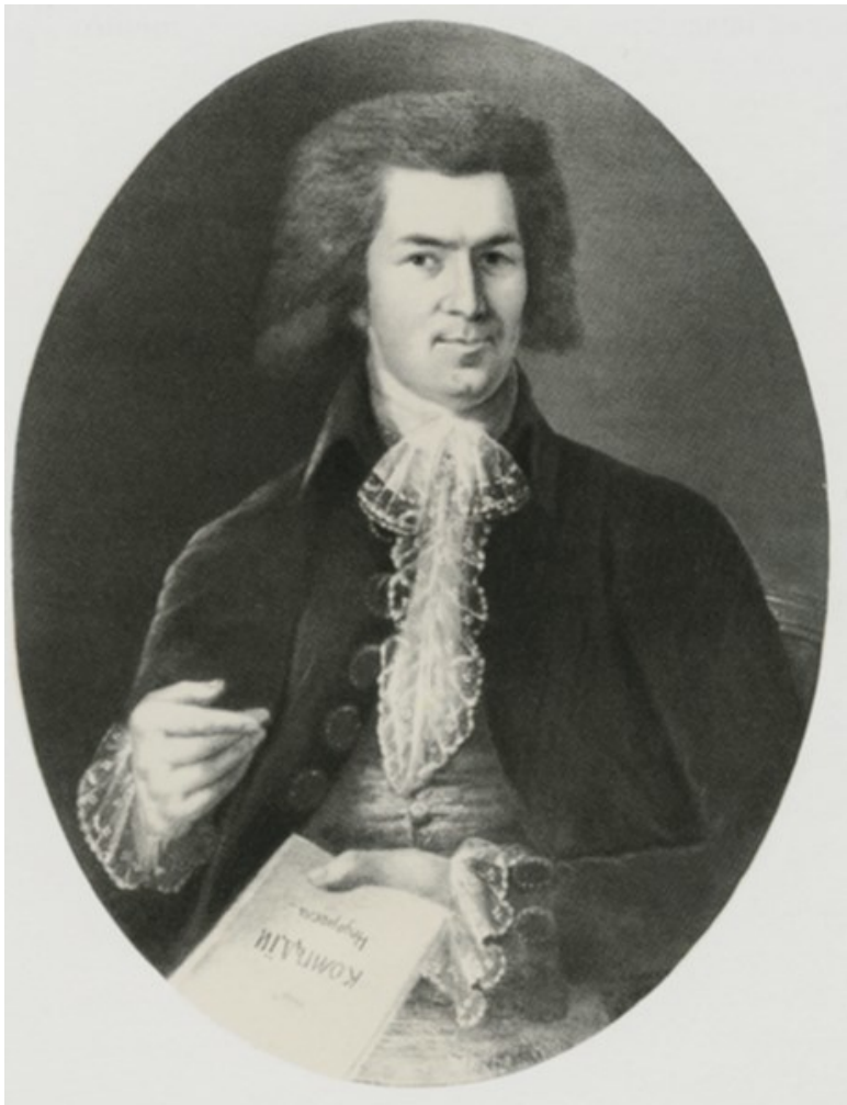
Иван Афанасьевич Дмитревский (1734–1821), ак-